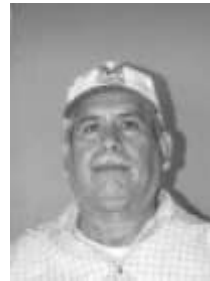
Compilador: Porfirio Martínez Vázquez