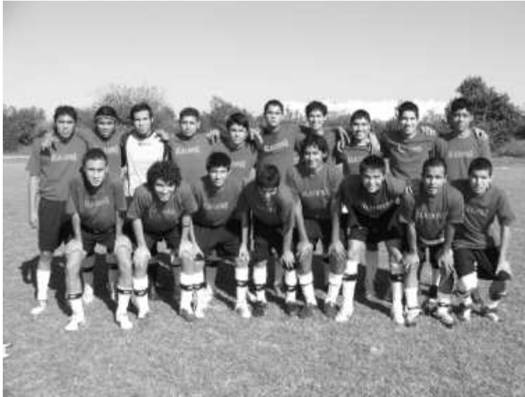
Los Alazapas terminaron la temporada cayendo con la cara al sol en la Liguilla,

Con una muestra de sed de triunfo, coraje deportivo, actitud positiva ante la adversidad y con las ganas de demostrar que su entrada a la liguilla no fue casualidad, los Alazapas de Sabinas Hidalgo vencieron a domicilio por 2 goles a uno al Calor de La Laguna el sábado 11 de noviembre.