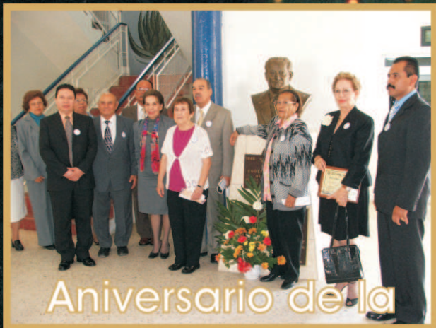
Aniversario de la Normal