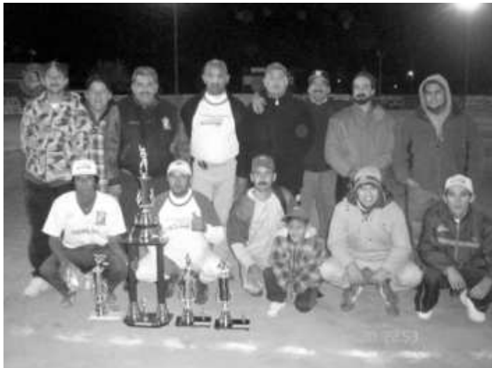
Los Nenes se coronaron en el softbol nocturno.