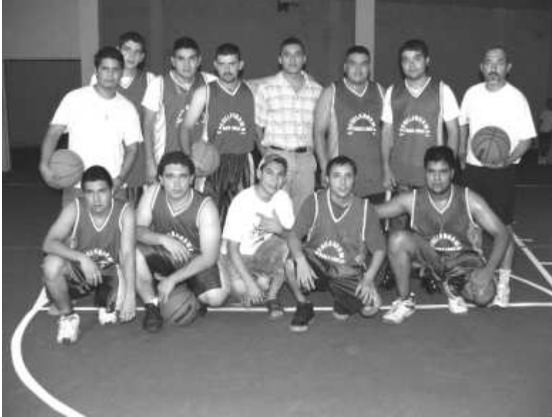
El equipo de la Normal "Pablo Livas" consiguió su primera victoria en el último juego del torneo.

Q uedaron definidos los cuatro semifinalistas del torneo municipal de basquetbol denominado "Profr. Francisco Guardiola Zapata" coordinado por el Profr. Federico Chávez Jasso.