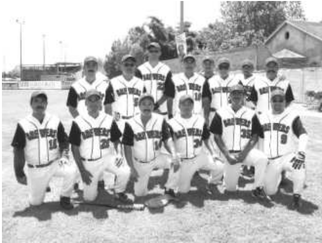
Cerveceros derrotaron a los Aztecas de Bustamante.