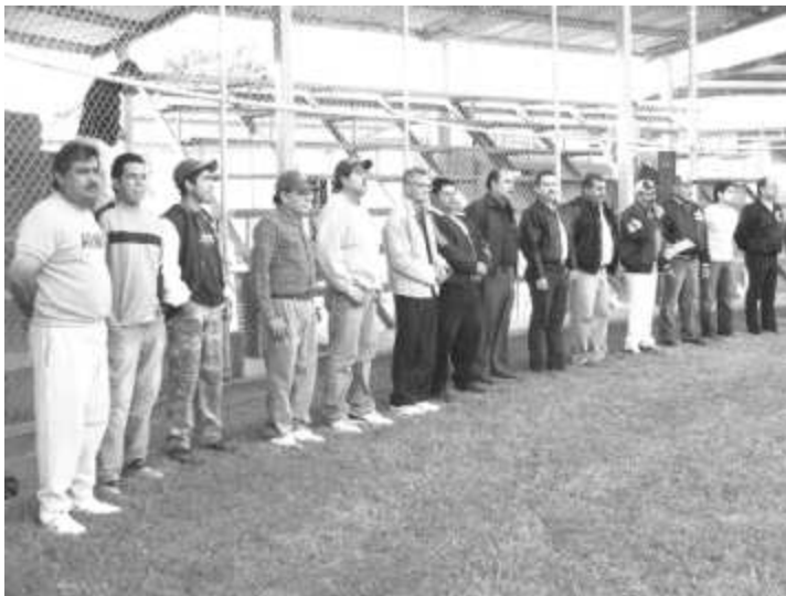
Autoridades e invitados de honor a la inauguración.