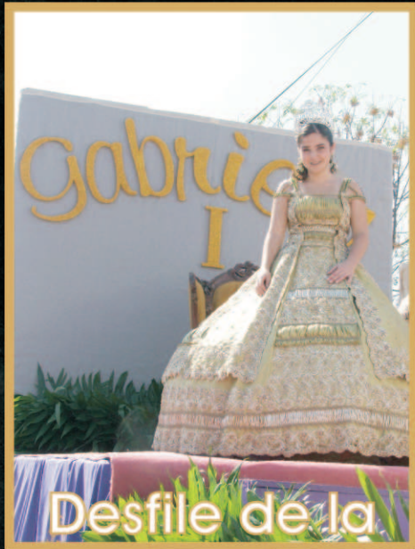
Desfile de la Revolución