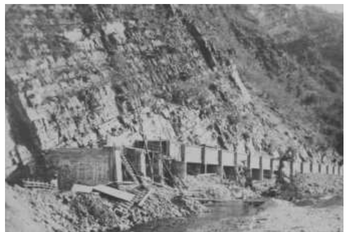
Construcción de La Turbina.